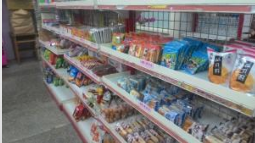
國立台灣師大附中 105 學年度第二學期合作社六月份現做新鮮蛋糕甜點菜單