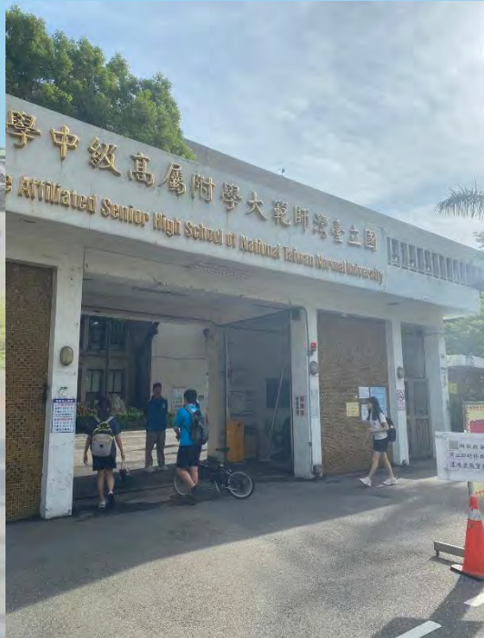
教官室同仁管制大門口