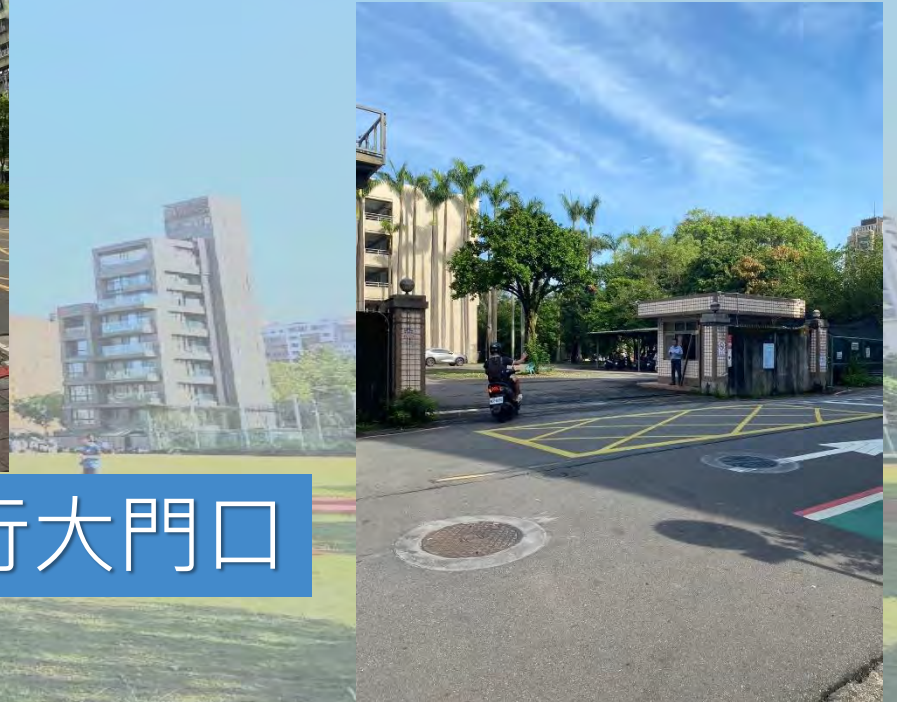
警衛同仁管制停車場出入口