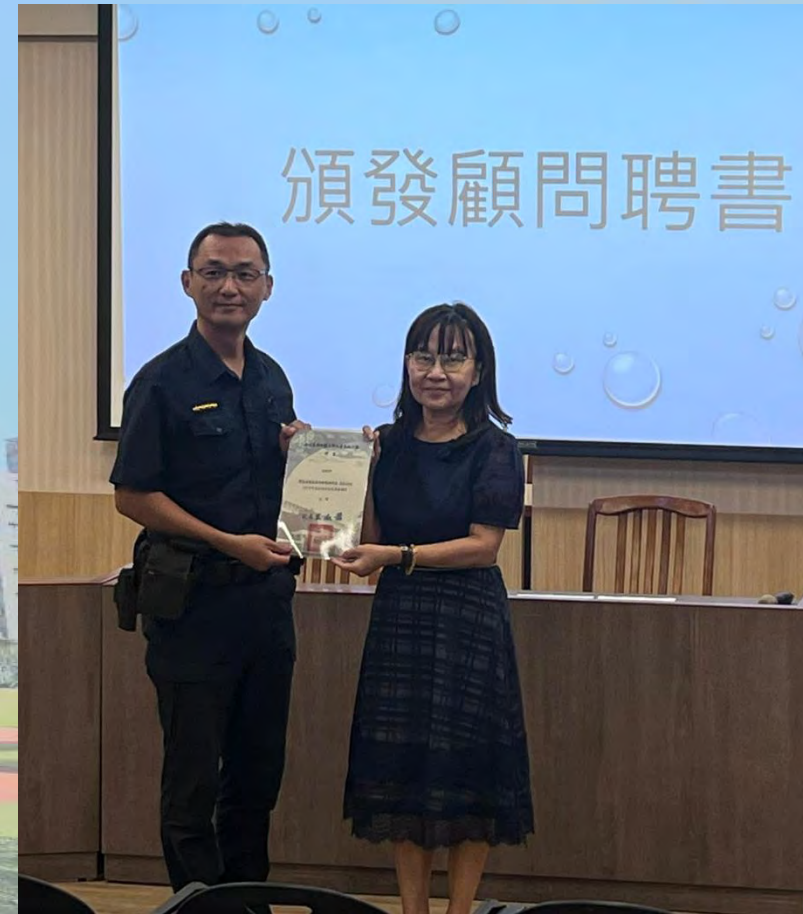
新生南路派出所所長