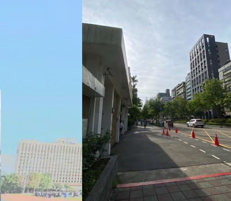
上放學時段車輛禁行大門口