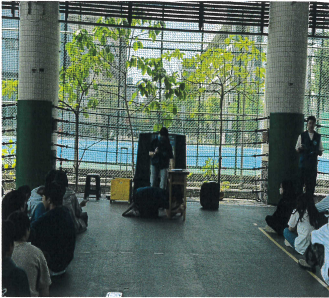
幹部訓練地震疏散與應變