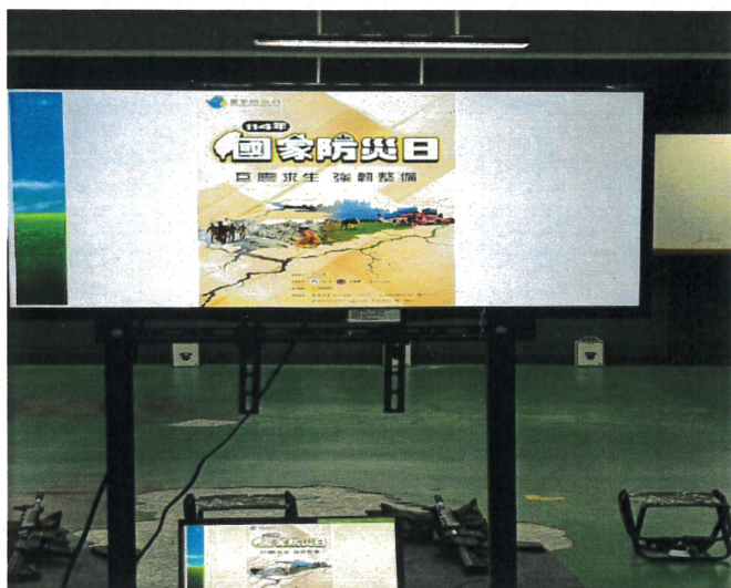
1630班地震疏散與應變