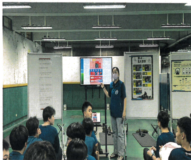
1630班地震疏散與應變