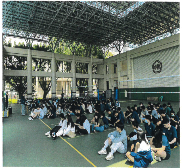
幹部訓練地震疏散與應變