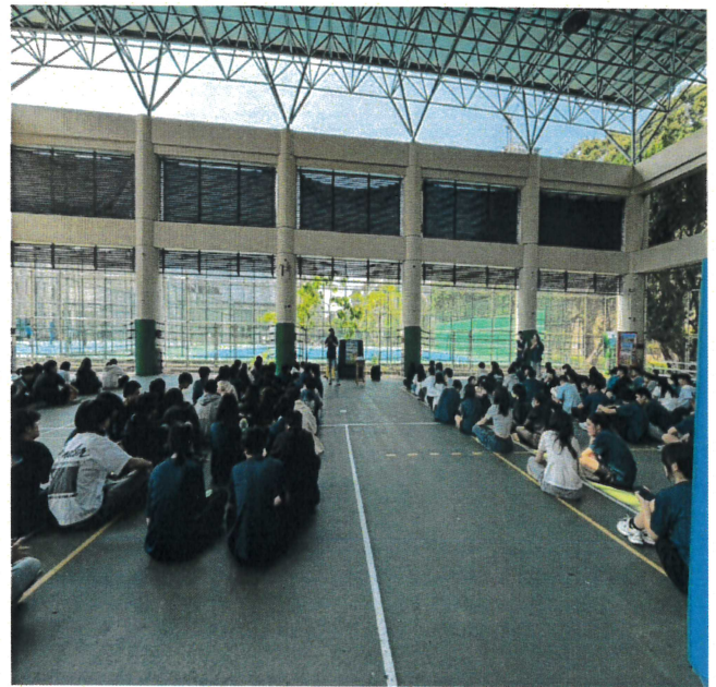
幹部訓練地震疏散與應變