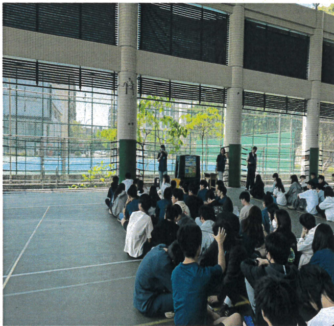
幹部訓練地震疏散與應變