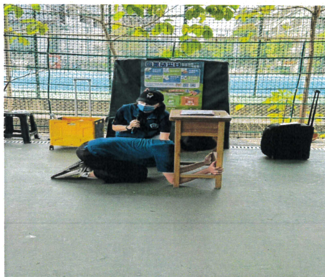
幹部訓練地震疏散與應變