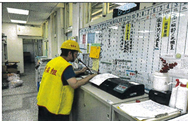
廣播下達地震演練