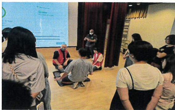
AED 及 CPR