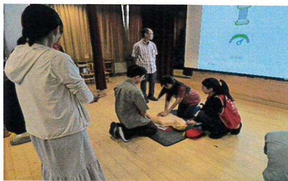
AED 及 CPR