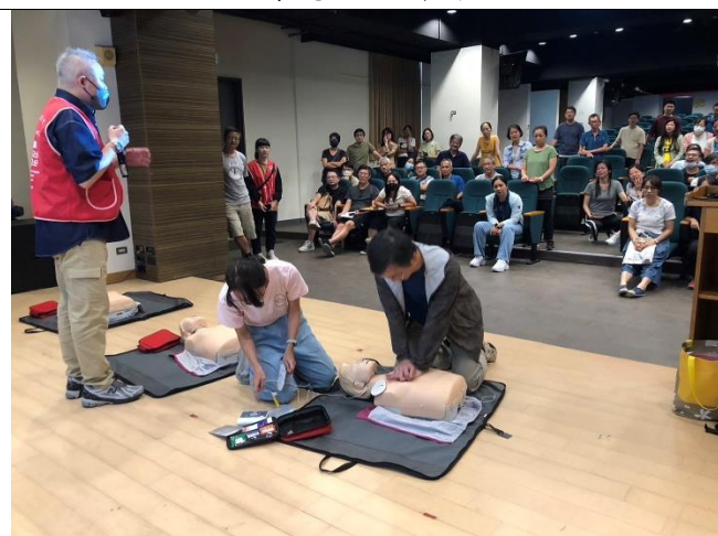
AED 及 CPR