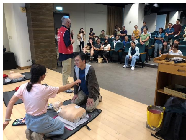
AED 及 CPR