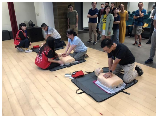
AED 及 CPR