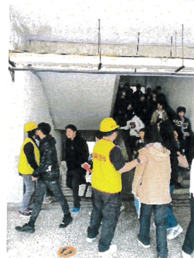
防空警報發布後前往防空避難處所