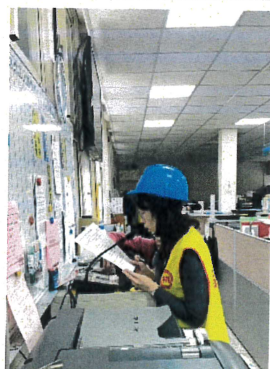
指揮官廣播下達疏散指令