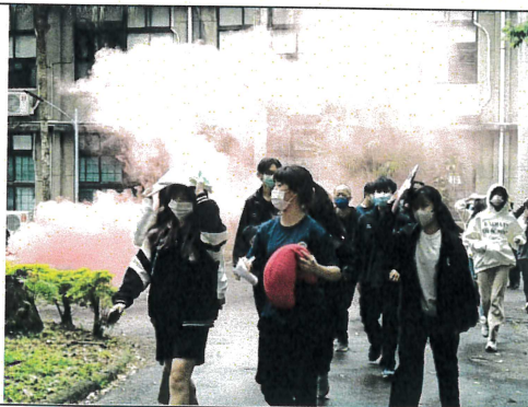
防空警報發布後前往防空避難處所