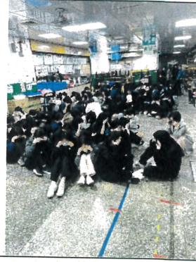
防空避難姿勢演練