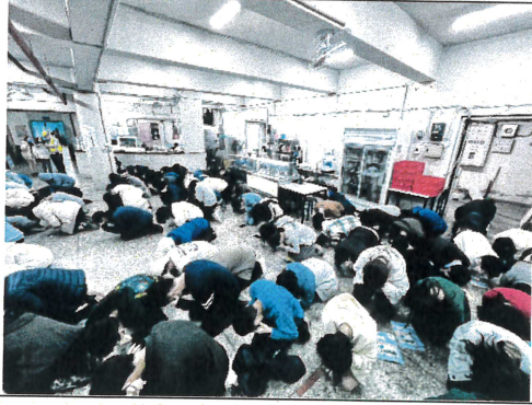
防空避難姿勢演練