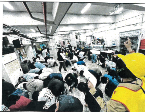
防空避難姿勢要領說明