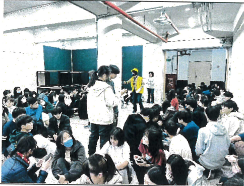
各區場域指揮官清查人數