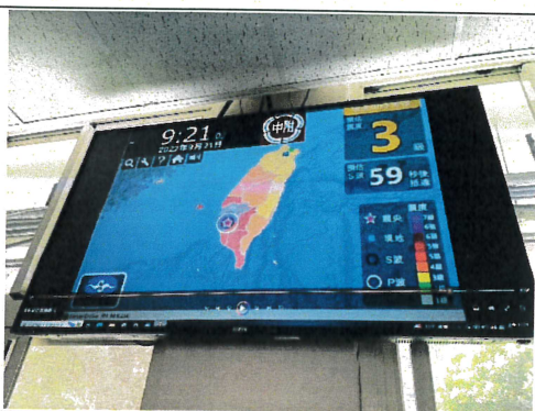
強震即時速報系統