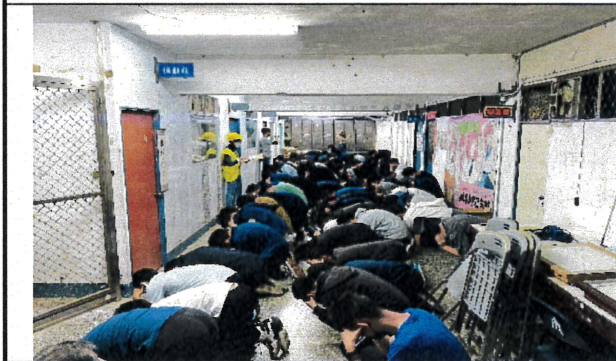
防空避難姿勢演練