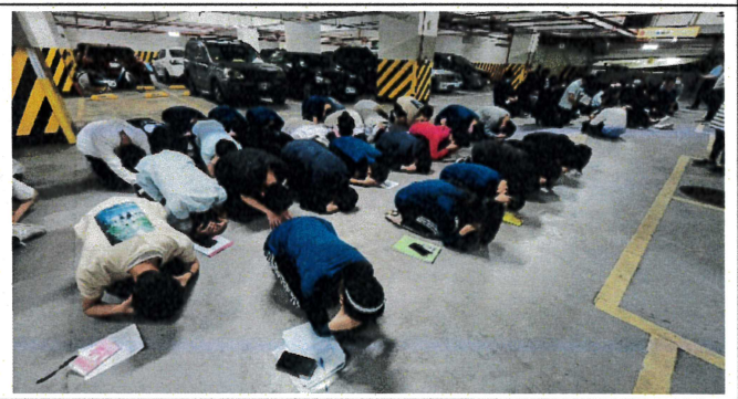
防空避難姿勢演練