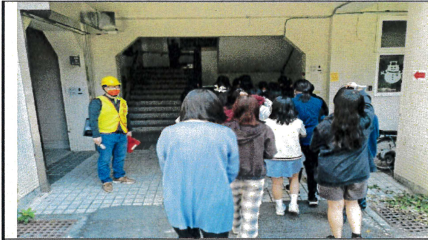
防空警報發布後前往防空避難處所