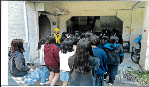
防空警報發布後前往防空避難處所