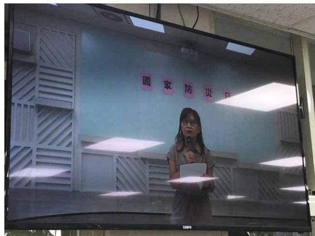
第三階段：校長致詞