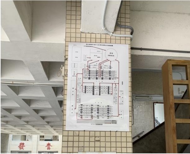
張貼中廊海報：班級疏散圖