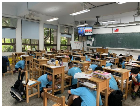
第一階段：就地掩蔽