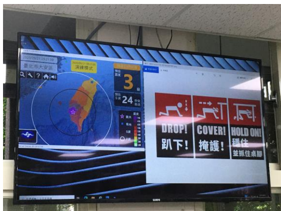
第一階段：地震速報