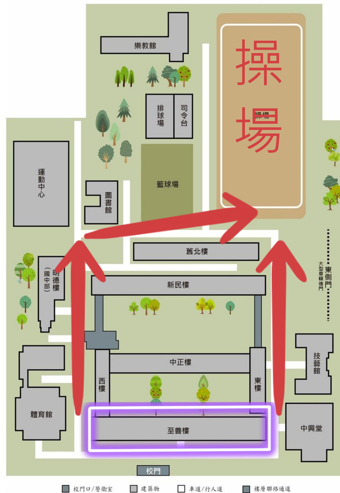
國立臺灣師範大學附屬高級中學校園平面圖